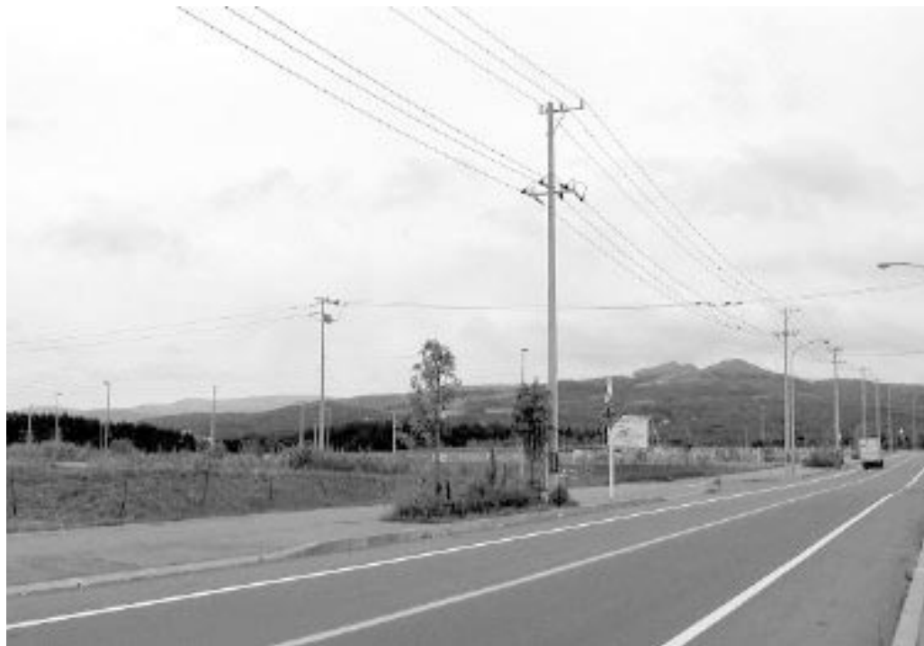
ここ7年くらいただの1社の企業進出もない 函館市の臨空工業団地（第2期造成団地）

このような年寄りを呼んでどうするのか。ボタンの掛け違いなんだ。地域を活性化するのに背に腹は代えられないという話ではない。モノを食わない、モノ買わない老人に生涯ここにいて