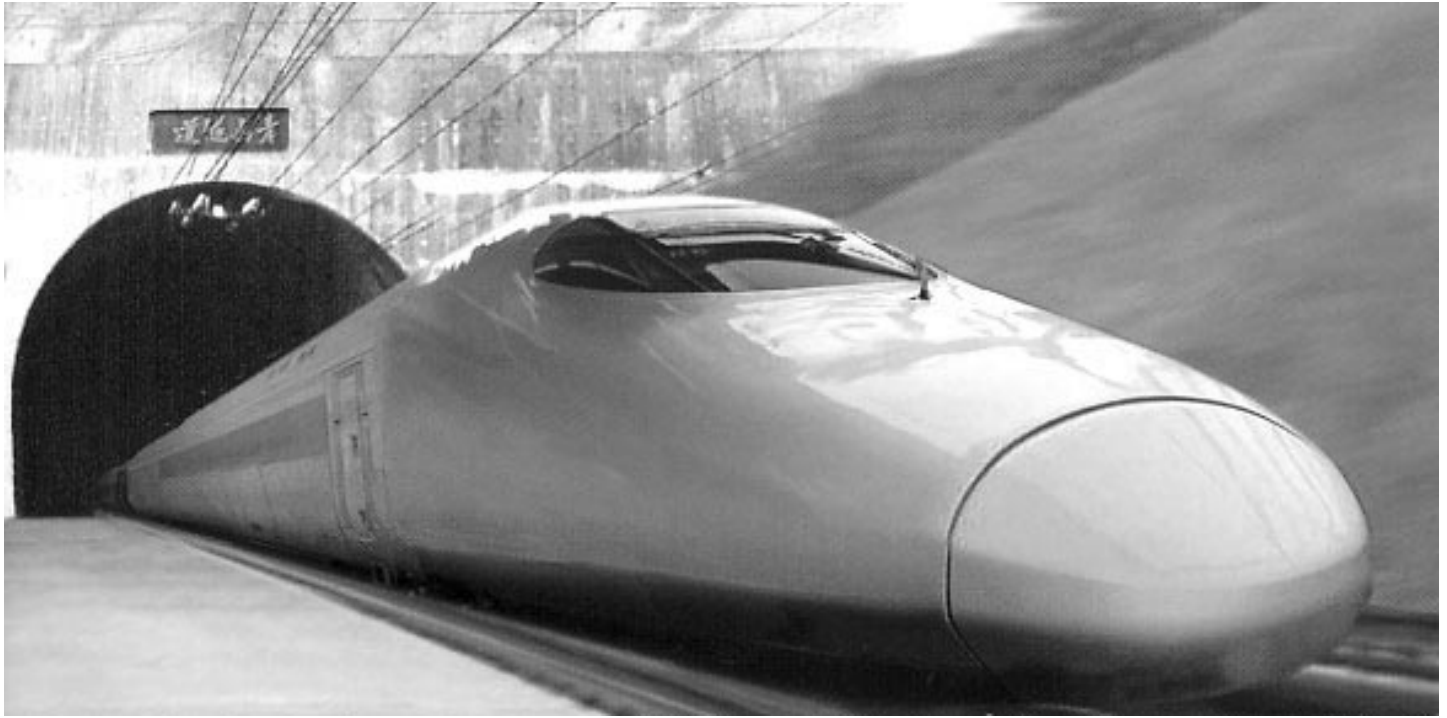
あと7～8年で北海道新幹線・新青森 新函館間が開業する

幸い函館商工会議所には1000人を超える 青年部があり、フットワークがいい! 彼ら次の世代は危機感を持っている